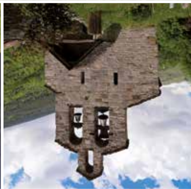
Santa Maria de Cardet