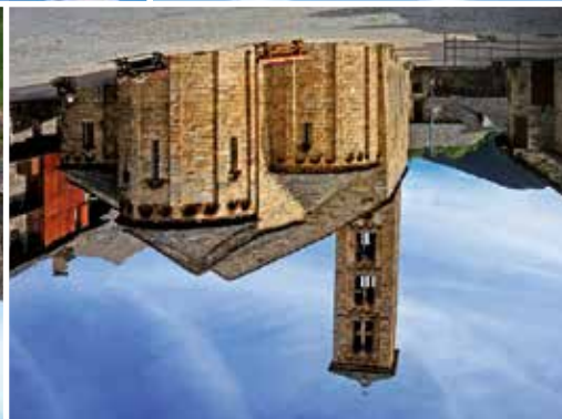
Santa Maria de Taüll