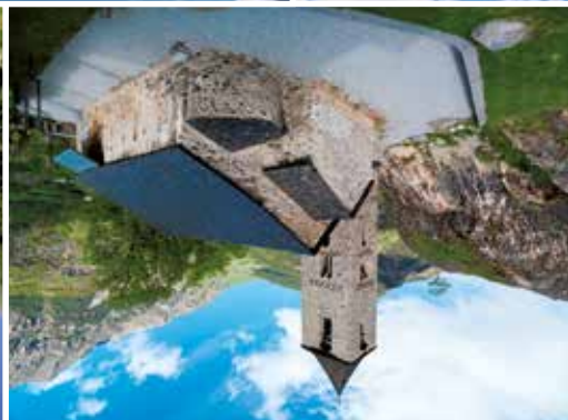
Sant Joan de Boí