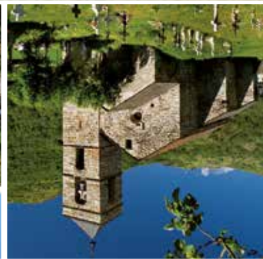
Sant Feliu de Barruera