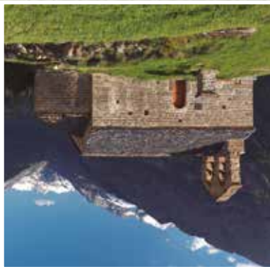
Sant Quiric de Durro