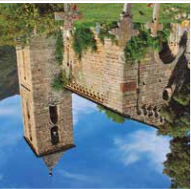
l'Assumpció de Coll